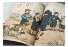
スポット展「戦時下の暮らし」 『講談社の絵本』より