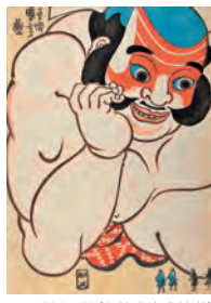
歌川国芳《朝比奈小人嶋遊》(部分)

一般 1,200(960)円 大・高生 500(400)円 中・小生 300(240)円