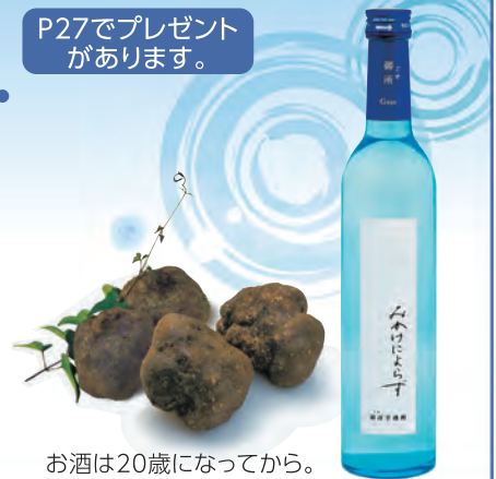
お酒は20歳になってから。