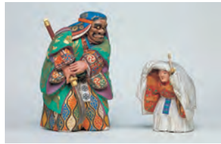
森川杜園「能人形 牛若・熊坂」 明治時代(19世紀) 東京国立博物館蔵