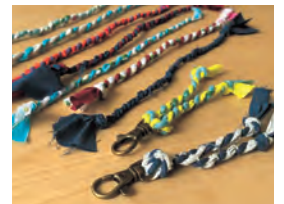
ワークショップ作品例 ハギレで編まない体験