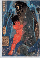
歌川国芳(坂田怪筆丸)

一般 1,200(960)円 大・高生 500(400)円 中・小生 300(240)円