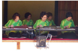
古民家活用イベント 「大正琴のしらべ」