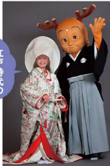
館内フオトスポットで記念写真をパチリ!