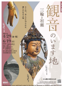
企画展 観音のいます地

●印のある問い合わせ先の所在地は、 奈良県庁 〒630-8501 奈良市登大路町30番地です。