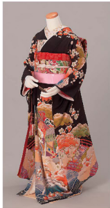
黒縮緬地松梅御所車橋模様振袖 (東京家政大学博物館蔵)