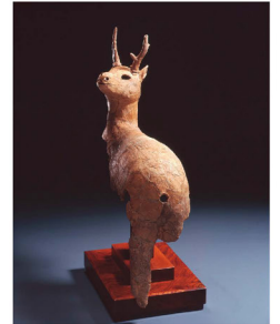
〔重要文化財〕 埴輪 見返りの鹿/平所遺跡 (島根県蔵)