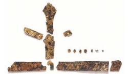
〔重要文化財〕 金銅製冠/上塩冶築山古墳 (出雲弥生の森博物館蔵)