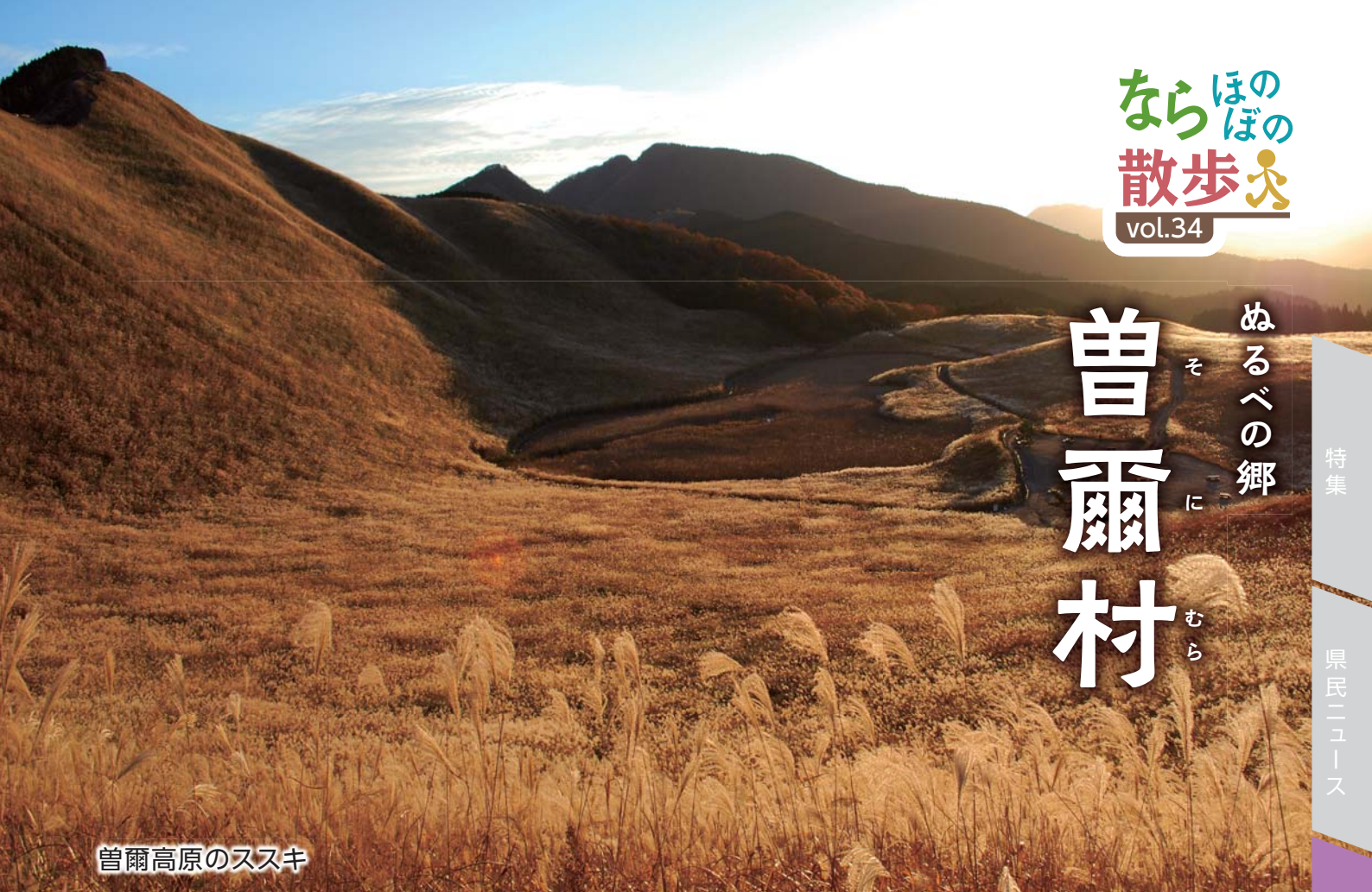
曽爾高原のススキ