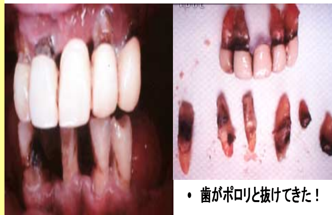
・歯がポロリと抜けてきた！

この写真は、1日80本たばこを吸って、40歳で、すべての歯が入れ歯になった男の人の歯の写真です！