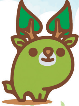
奈良県エコキャラクター な〜らちゃん

講座や工作・実験を通じて、 再生可能エネルギー、省エネルギー、 水素エネルギーについて、 見て・ふれて・学べる 2つのイベントを開催します。