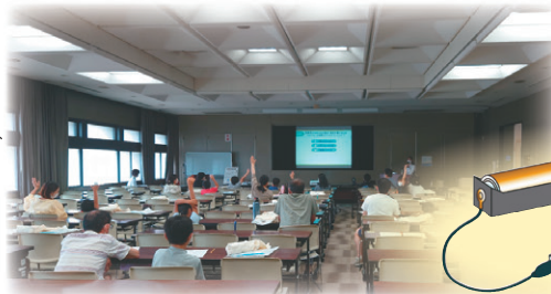
前回のエネルギー教室の様子