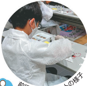
前回の水素イベントの様子