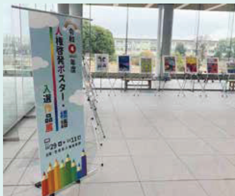
昨年度の作品展示の様子(県立図書情報館)