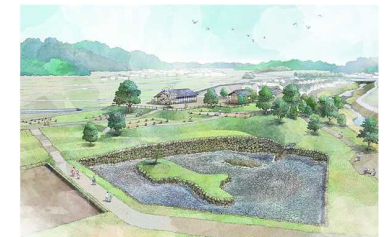
飛鳥京跡苑池(南池)復元イメージ