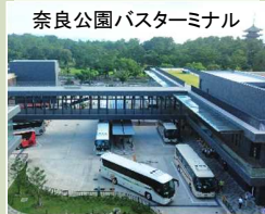
おもてなし機能の充実