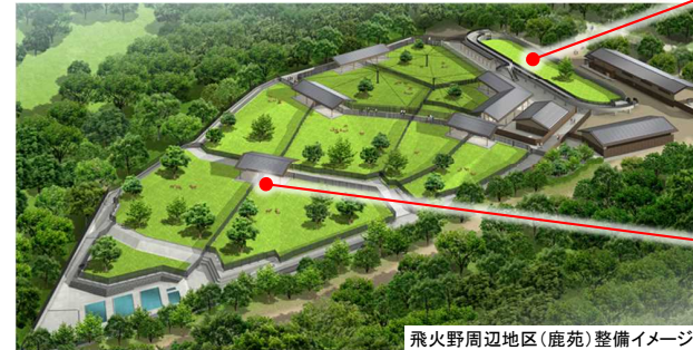
飛火野周辺地区(鹿苑)整備イメージ