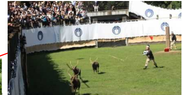
秋を彩る奈良の伝統行事 鹿の角ぎり