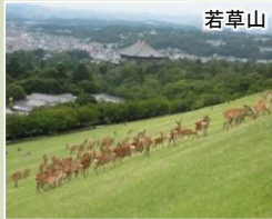
歴史的風土の保全