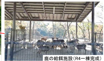
鹿の給餌施設(R4一棟完成)