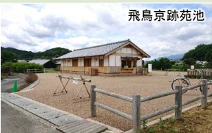
おもてなし機能の充実