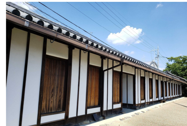
史跡北山十八間戸