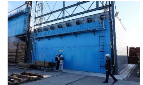
品質向上のための乾燥施設整備

○ 公共建築物等非住宅建築物の木造・木質化の推進のための 財政支援等 を充実していただきたい。