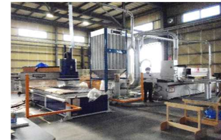
生産効率向上のための加工ライン整備