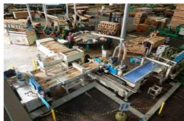
製材工場の能力強化 (県産スギ間柱製造ライン)