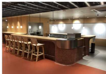
公共建築物の内装木質化 (奈良まほろば館 東京 新橋 令和3年8月オープン)