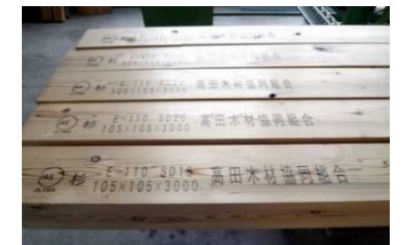
奈良県で生産されたJAS製材品