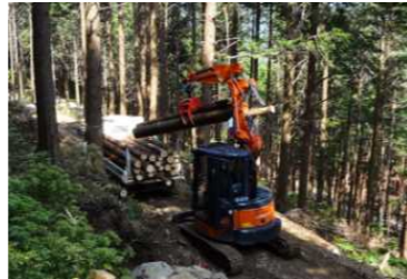
車両による集材に適した奈良型作業道