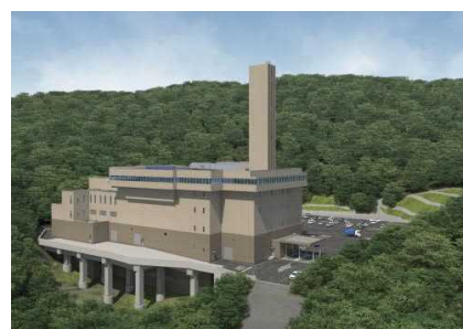
香芝・王寺環境施設組合