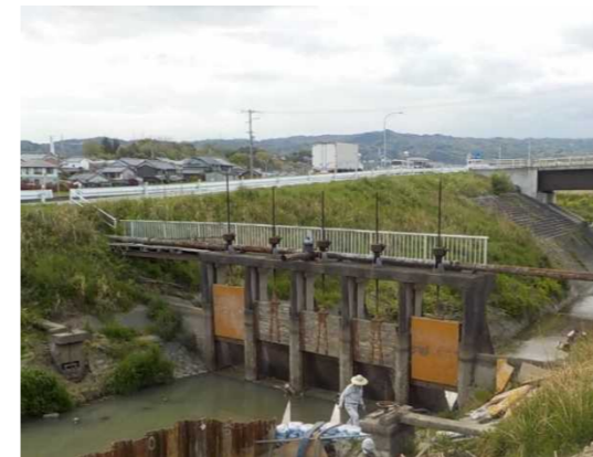
老朽化した井堰（河合町城内）