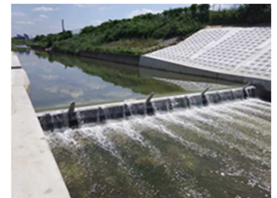
全面更新した井堰（大和高田市松塚）