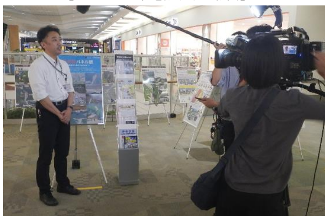
【メディアによる取材】