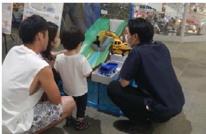
【砂防堰堤の働きについて学ぶ模型を体験する来場者】