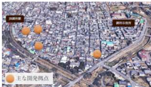
ホテル・レストラン等を一体的に整備

NOTE奈良による、まちづくりプロジェクト第1弾 「GOSE SENTO HOTEL プロジェクト」 2022年10月26日グランドオープン！