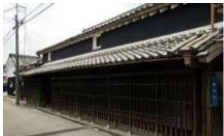
国の登録有形文化財 中井家住宅