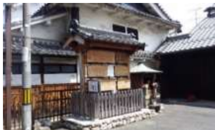
地元NPOにより復元された高礼場