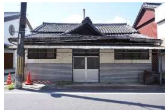
リノベーション前の銭湯「宝湯」