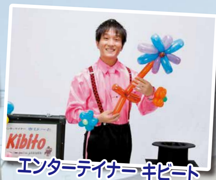
エンターテイナーキビート