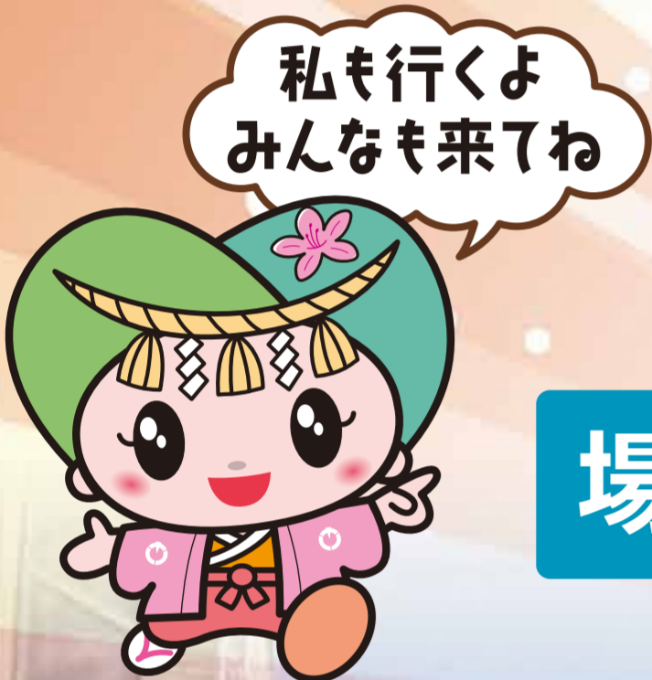
御所市マスコットキャラクター ゴセンちゃん