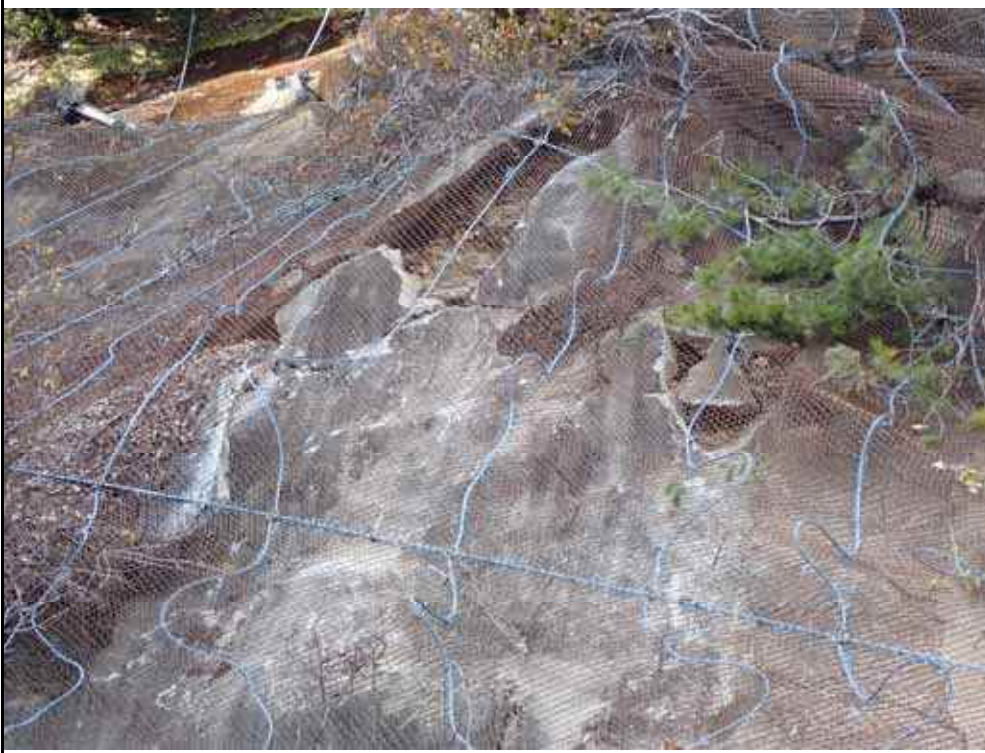
写真4：南側モルタル吹付亀裂の拡大