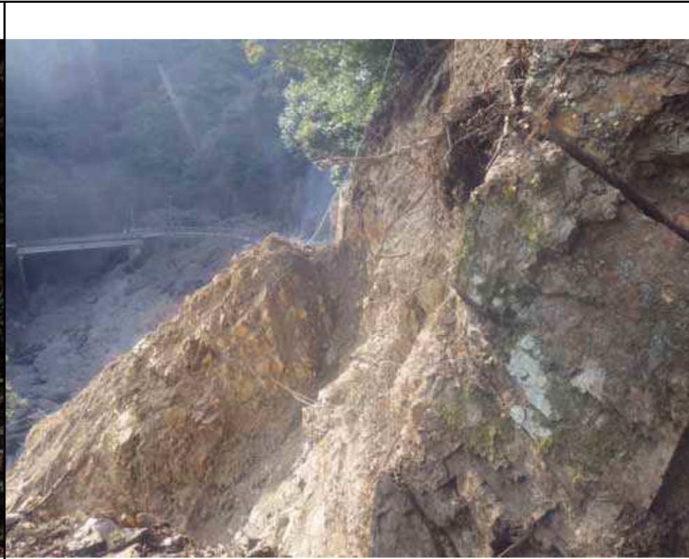
写真8：南側亀裂の状況