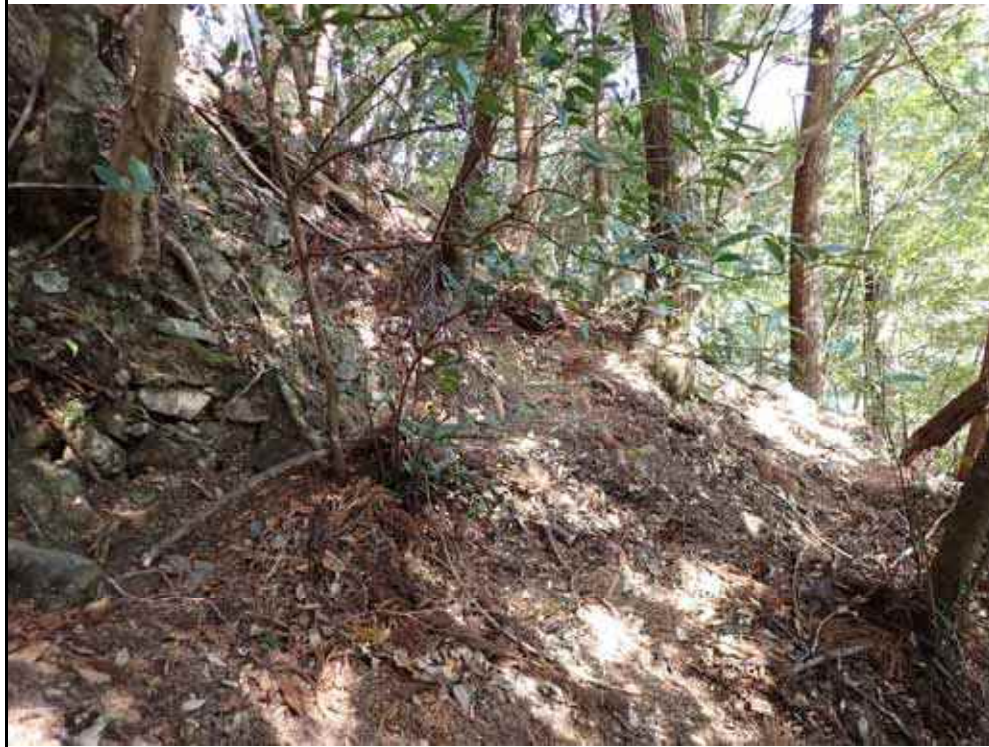
写真10:崩壊斜面の上部の状況