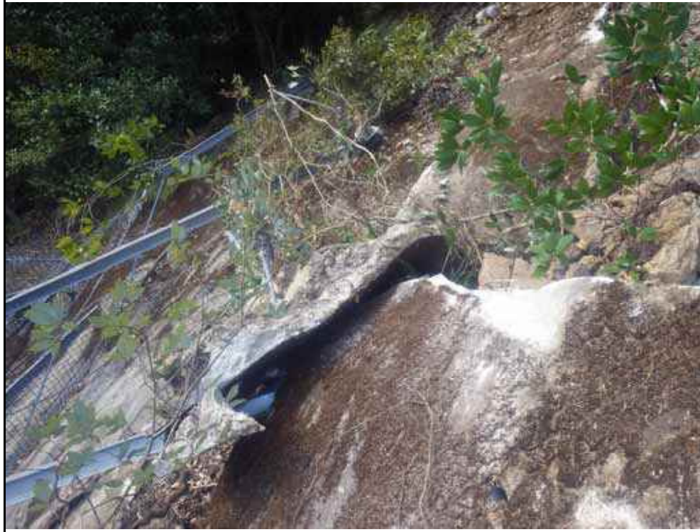
写真13：南側亀裂の状況（モルタル吹付の亀裂）