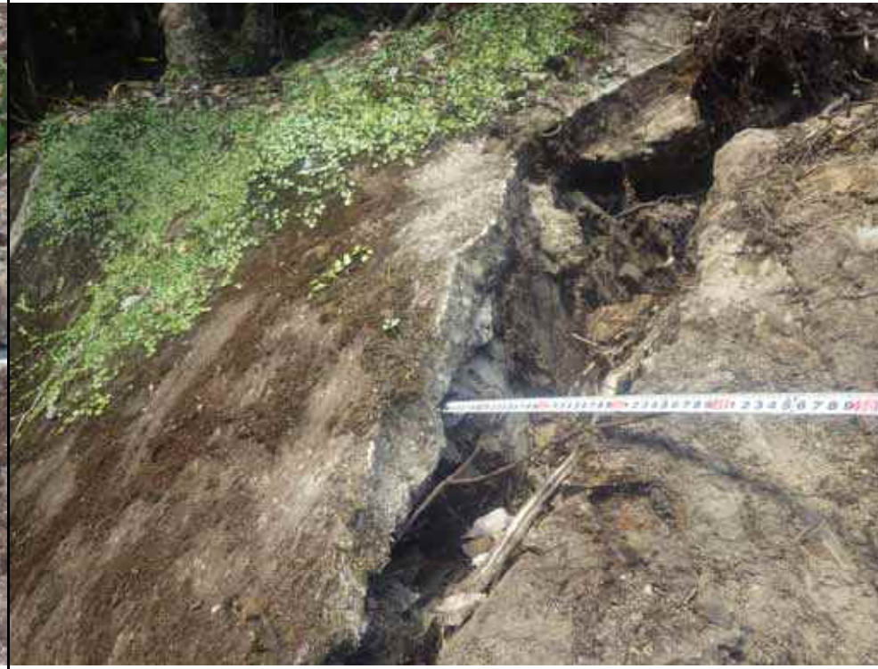
写真14：南側亀裂の状況（モルタル吹付の亀裂）