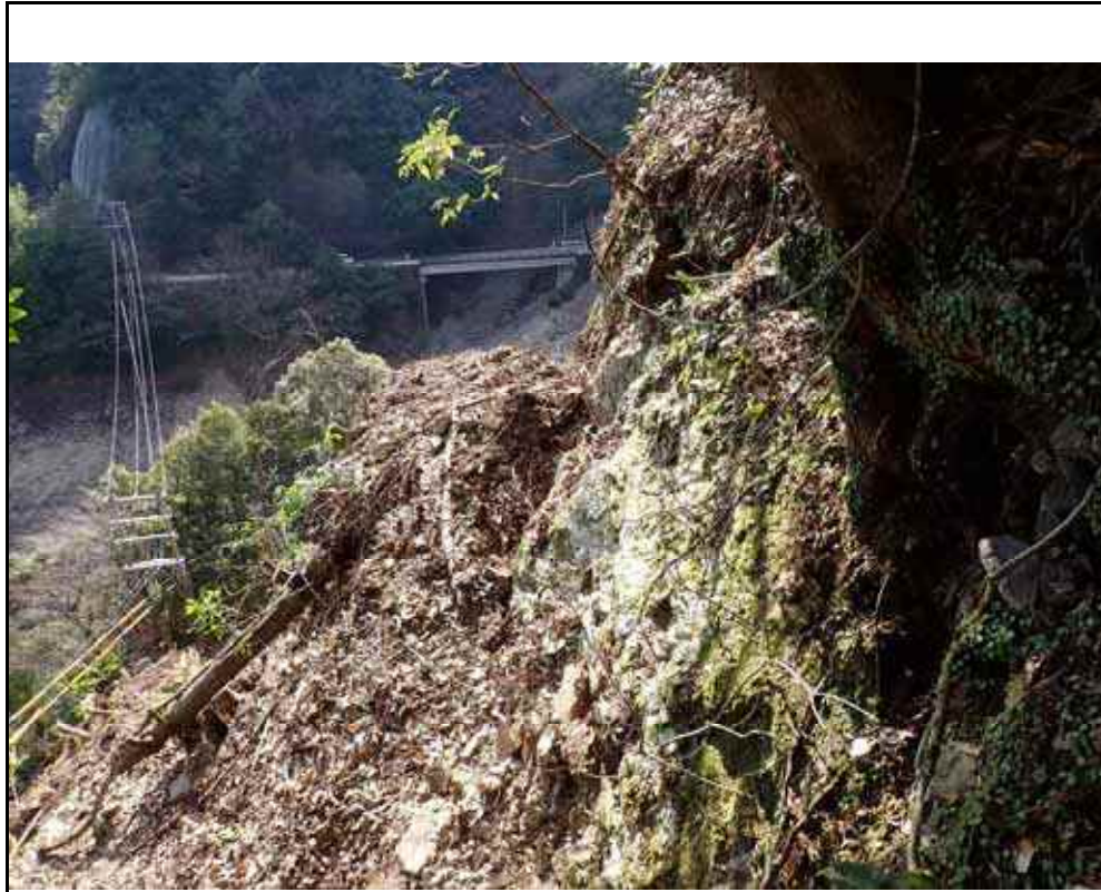
写真7：北側上部の亀裂の状況