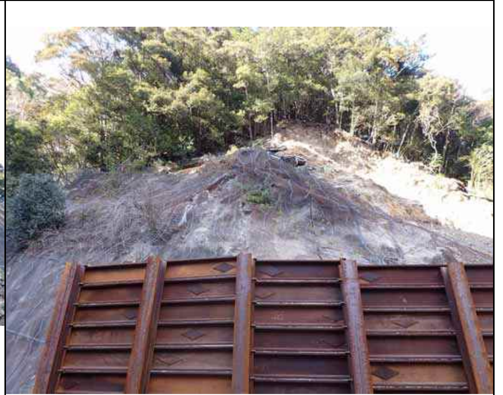
写真3：南側モルタル吹付の亀裂