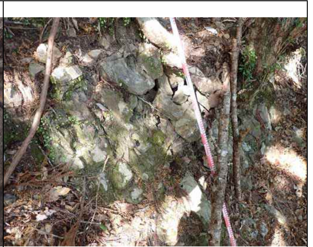
写真9：上部斜面の岩盤のゆるみ