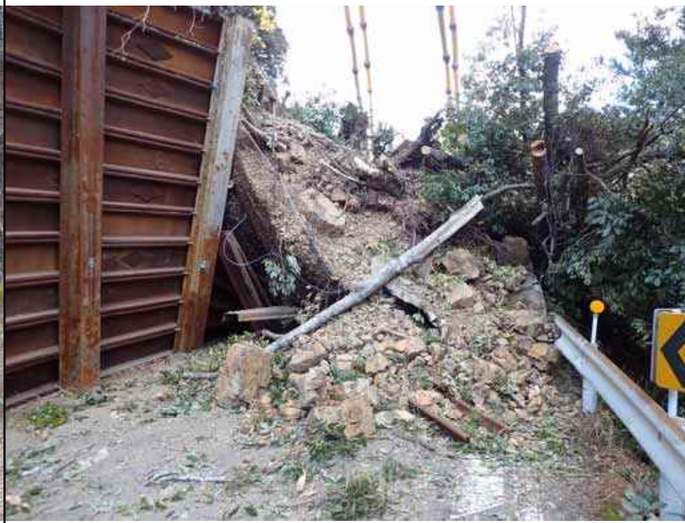
写真5：南側崩壊土砂の状況