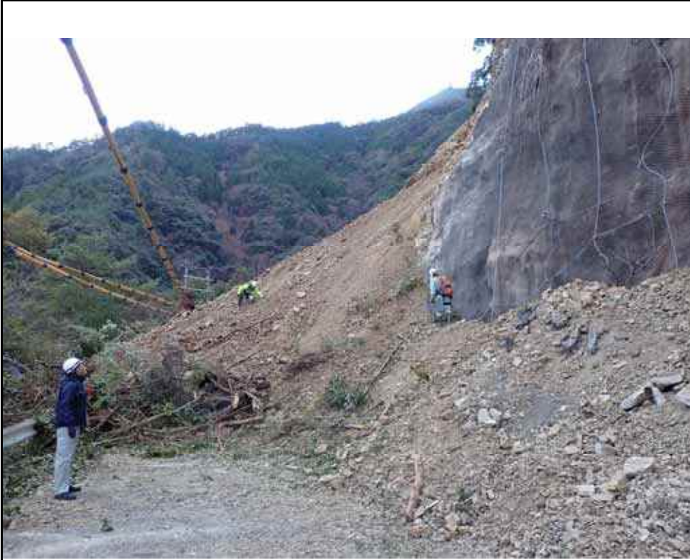
写真1：北側崩壊状況