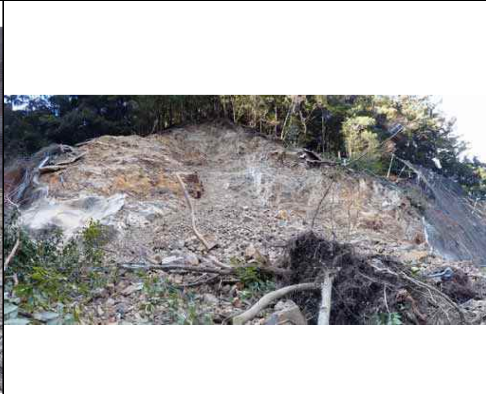
写真2：崩壊斜面状況