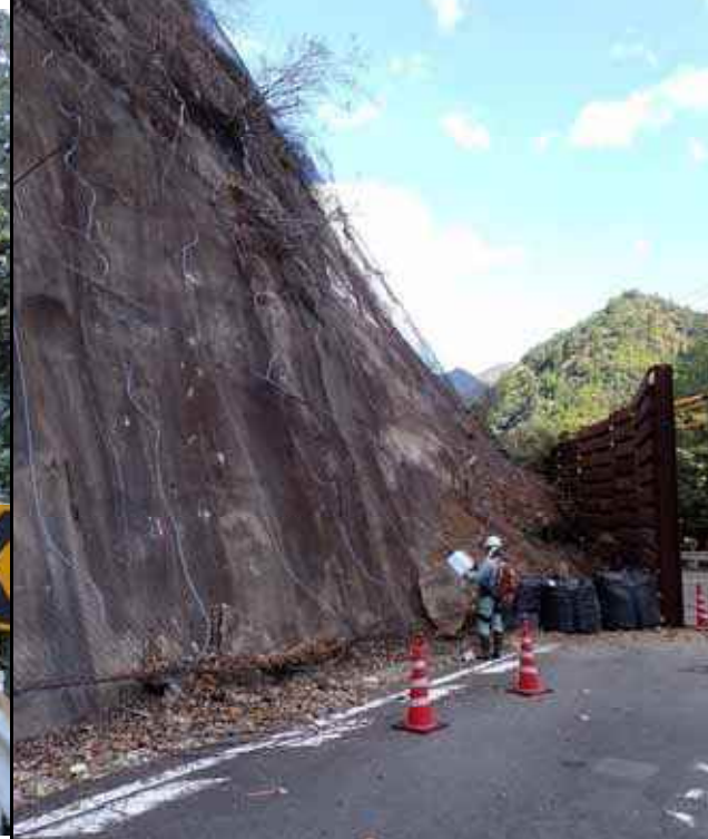
写真6：南側道路状況