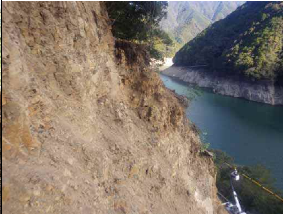
写真11：北側崩壊の状況