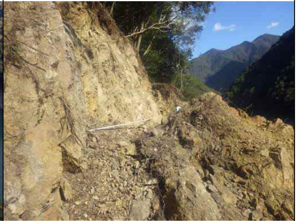
写真15：南側崩壊の状況