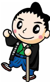
十津川村マスコットキャラクター 郷士くん