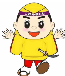
野迫川村マスコットキャラクター これもりくん