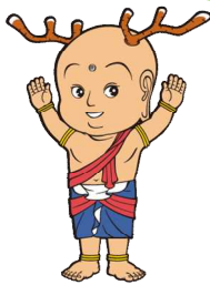
奈良県マスコットキャラクター せんとくん