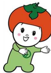
五條市マスコットキャラクター カッキー