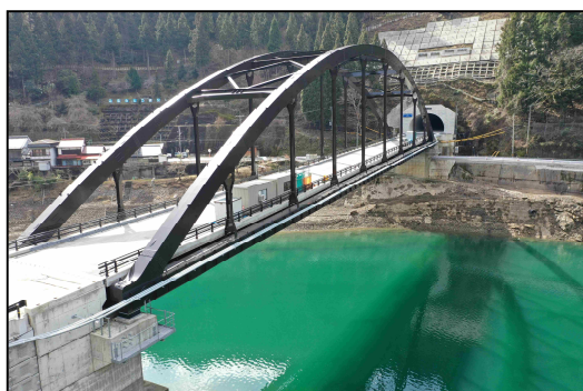
今回開通区間 (阪本側)