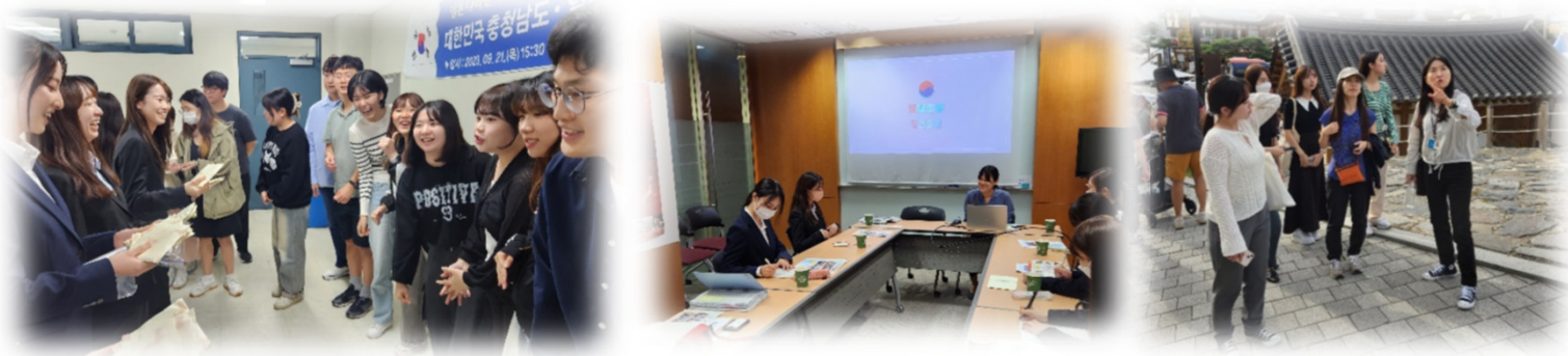
チュンチョンナンド