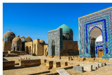
シャーヒズィンダ廟群

サマルカンドにあるレジスタン広場やシャーヒズィンダ廟群をはじめ、ティムール帝国の時代に建てられた歴史資産などが「サマルカンド-文化の交差点」として2001年にユネスコ世界文化遺産に登録されています。