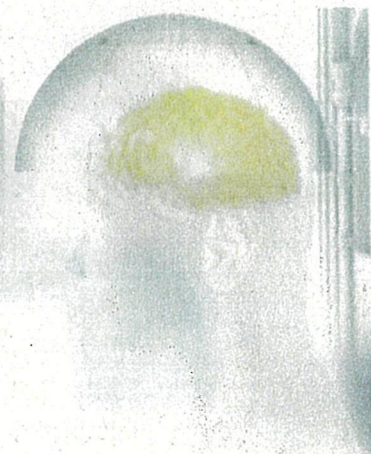
ホスレボドパ ホスカルビドパ水和物 持続皮下注射療法 CSCI

Copyright © AbbVie. All rights reserved.