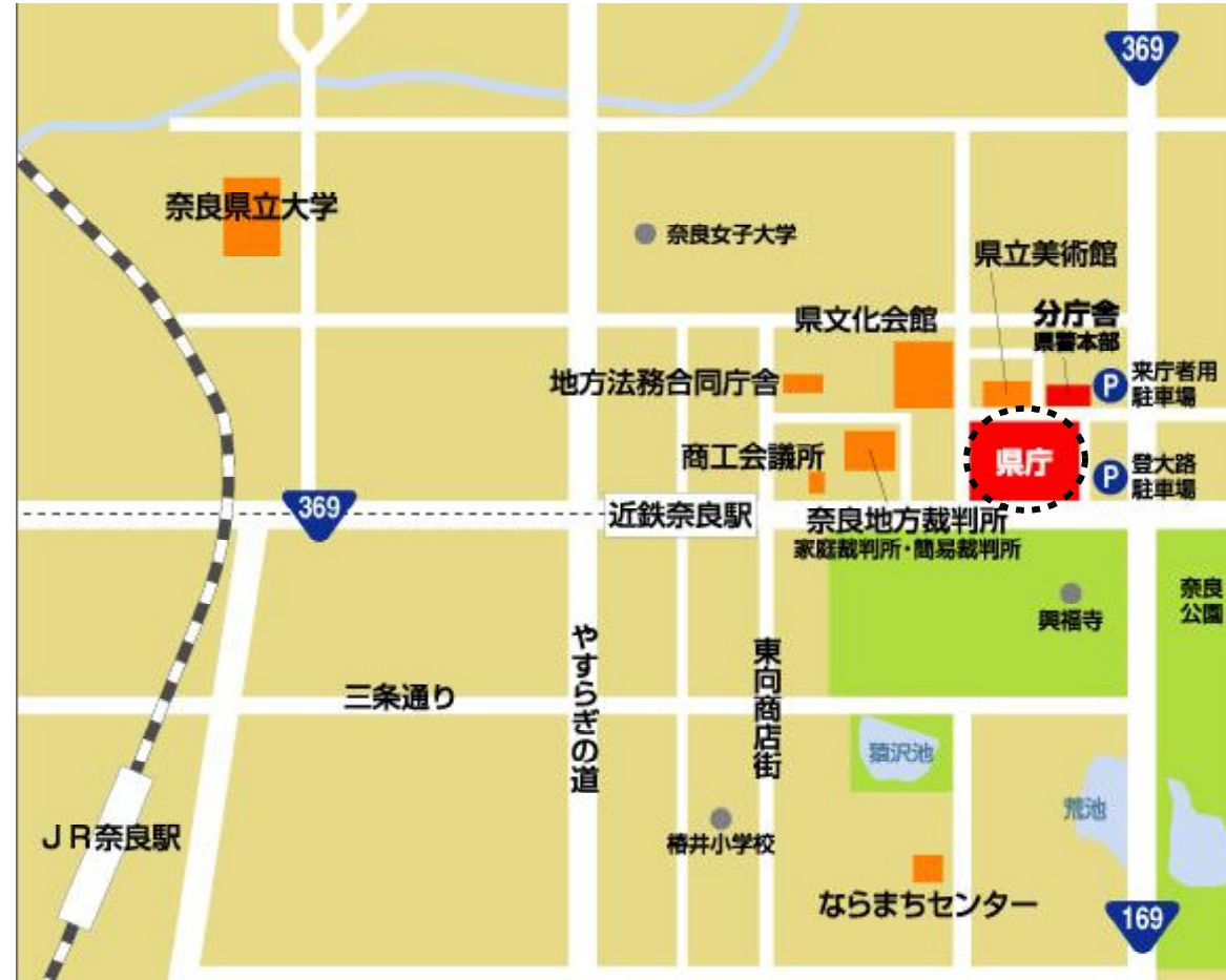
[奈良県庁周辺見取図]