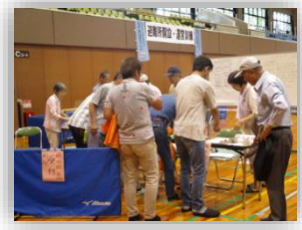
○桜井市織田小学校区住民による避難所体験&運営

★県内福祉医療関係団体参加者による、J-SPEED と模擬避難所アセスメント訓練を実施