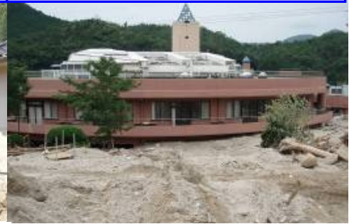
7月21日、土石流により特別養護老人ホームで死者7人の被害