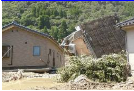
8月9日、佐用町では水害により死者18人、行方不明者2人の被害