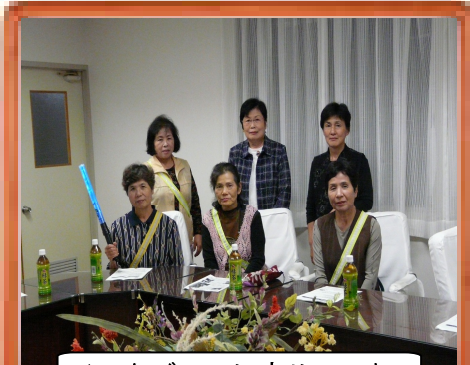
インタビューに応じていただいた姫の皆さん（役場）

日本固有の歴史的文化的資産を有する明日香村。盗難や火災の未然防止はことのほか気になる関心事ですが、この地の安全・安心は、村民と行政との協働により守られています。