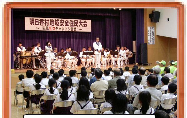
明日香村地域安全住民大会 ～犯罪ゼロチャレンジ作戦～

全国地域安全運動に先駆け、毎年10月1日に村と警察署の共催で明日香から「犯罪ゼロ」を発信する決起大会。文化財防犯の講演や恒例の警察音楽隊の演奏など、村民同士楽しんで防犯意識を高める村の風物詩となっています。