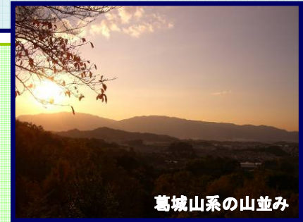
葛城山系の山並み

○「記紀・万葉及び伝承」に記された(口伝された)様々な素材について、「何を」「どのように」「だれに」伝えるのかを検討・整理します。