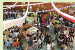
希望ヶ丘フェスタ

プロジェクト実行委員会が実施主体となり、平成23・24年度に、「希望ヶ丘通学合宿」を実施しました。また、PTA主催の「希望ヶ丘フェスタ」も好評で、児童と地域の人たちとの対話が増えたと感じる家庭が18ポイント増加しました。