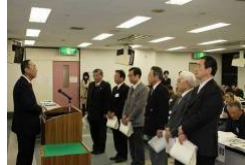
平成21年度の表彰式