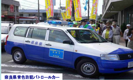
奈良県青色防犯パトロールカー