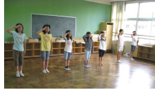
いかのおすしー人前のダンス (町立河合第三小学校金管バンド&モア)