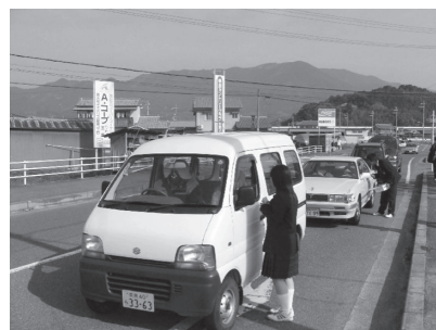
〈交通安全マスコット配布〉

単車通学生に対し五條自動車学校を会場に実技講習会を実施し、安全意識の高揚を図るとともに、交通社会の一員としての自覚を高め、自他の生命を大切にすることの重要性について認識を深めることができるようにした。