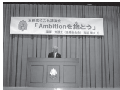
〈文化講演会(17年度2回目)〉