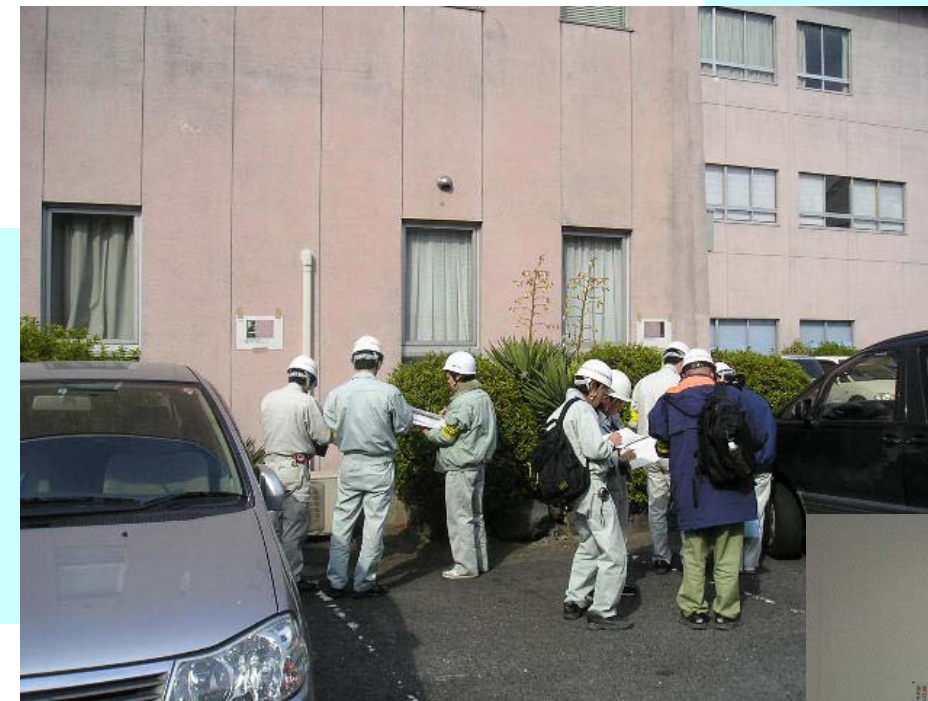
平成20年2月22日 大和高田市中央公民館にて