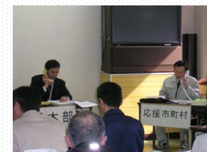
判定支援本部設置・支援要請