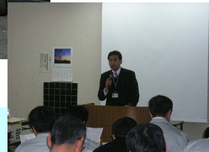
判定後の講評の様子