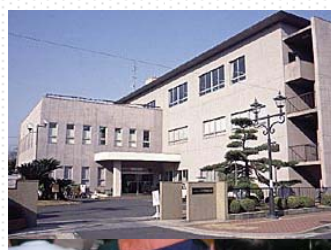
大和高田市中央公民館

また、最近の応急危険度判定の事例として、新潟県中越沖地震での判定活動の報告もいたしました。