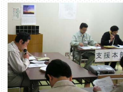
地震発生・判定実施本部設置