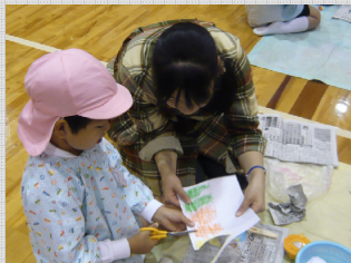
園児達は、花植えの前に、葉っぱや木の実を使った工作づくりを楽しみました。