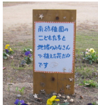
■ 花壇に設置された看板。園児が松ぼっくりなどで可愛く飾ってくれました。