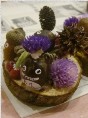
どんぐりに顔を描いて可愛いオブジェが完成。

子どもから高齢者までが住みやすいまちを目指し、癒しや安心を与え健康に暮らせる生活の場として河川空間を活用した「川辺のまちづくり」を進めるため、「飛鳥川を軸とした川辺のまちづくり懇談会」主催の花壇の花植えイベントが10月27日(水)開催されました。