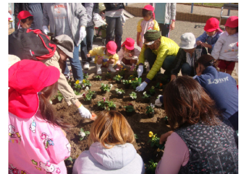
■ 花壇に一生懸命花を植える子ども達

して、飛鳥川周辺の環境が改善されつつあります。ぜひ、この状態を維持し、よりうるおいのある空間となるよう、皆様のご協力も宜しくお願い申し上げます。