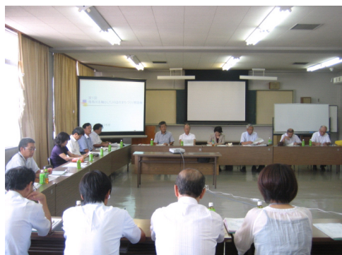
■ 第1回懇談会の様子

田原本町自治連合会(会長・副会長)・宮森自治会・多自治会・笠縫自治会・秦楽寺会長・町立南小学校・町立南幼稚園・県営福祉パーク・奈良県総合リハビリテーションセンター・奈良県心身障害者福祉センター・奈良県高等養護学校・奈良県立教育研究所・田原本町・奈良県