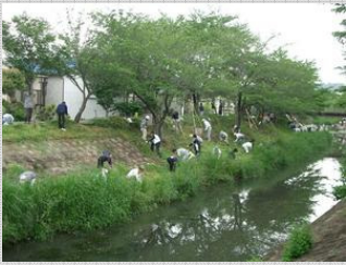
* 佐保川(奈良県) : 地域の人達が連携して河川の維持管理を実施。