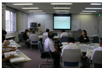
①川辺のまちづくりの背景等について説明