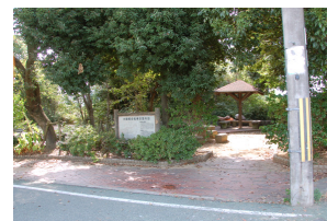
多宮橋付近にある駐輪場を外からみた様子