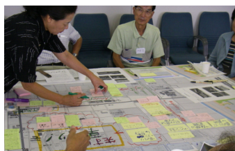
③意見は模造紙や地図にその場でとりまとめる