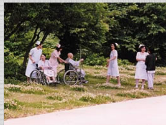
* 子吉川(秋田県) : 「癒しの川」として河川を活用。