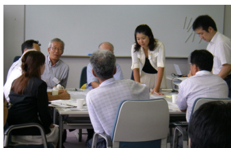
②グループ毎に意見交換を実施