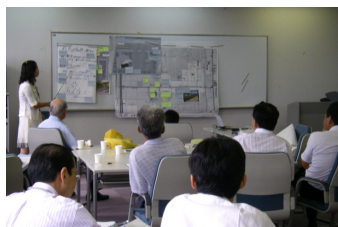
④最後にそれぞれのグループの結果を全員で確認

川辺のまちづくりに関連する各施策について幅広い意見を頂くため、9月14日にワークショップを開催しました。