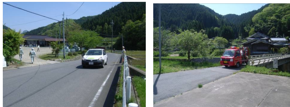
職員による管内巡視状況

職員による管内巡視を行い避難路の安全確認を行いました。また消防団による車両広報活動を実施しました。