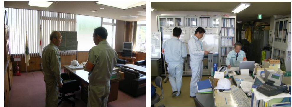
災害対策本部における避難勧告発令検討状況

土砂災害警戒情報の発表に伴い避難勧告が発令され、自治会長へは電話、地元住民へは防災無線放送により情報伝達されました。