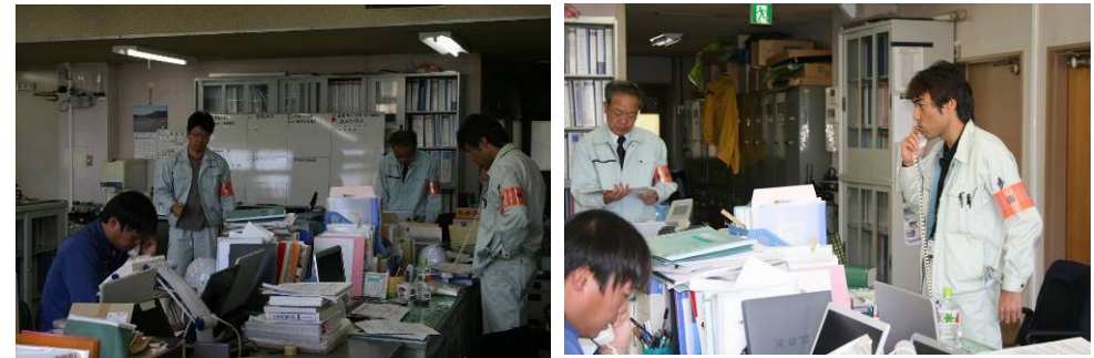
災害対策本部における情報伝達状況

村役場内に設置された対策本部で、気象情報や避難に関する情報収集や情報伝達の訓練を行いました。