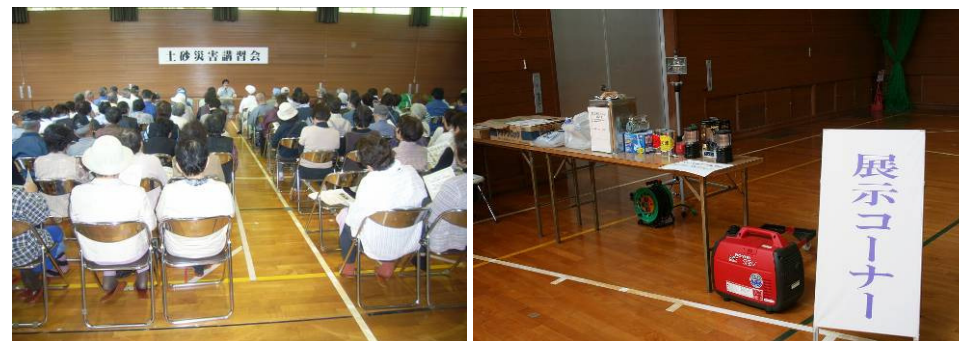
土砂災害学習会状況

避難所に集まった住民の方々に対して、土砂災害の危険性や避難の重要性、そして土砂災害警戒情報について等の説明を行いました。また、防災グッズや土砂災害に関するパネル展示も行いました。