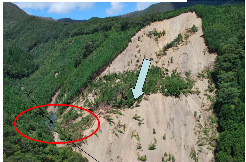
河道閉塞状況(下流側から撮影)