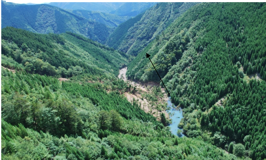
河道閉塞状況(上流から撮影)