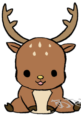
でいあ (DEER) ちゃん