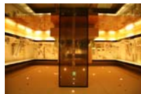
▲唐古・鍵考古学ミュージアム