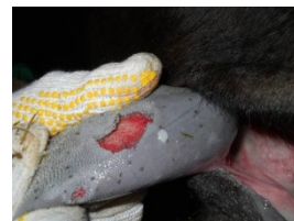
舌のびらん（黒毛和種）

39. 0度以上の発熱、流ぜん、口やひづめに水ほうやびらんなどがあれば、家畜保健衛生所へ届け出ることが義務化されました。