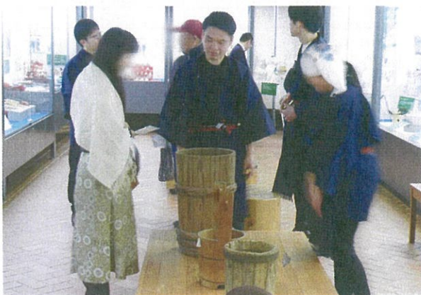
秋まつりでのワークショップと展示解説の様子

約 2 ヶ月の会期中には、展示の開会式や解説、小学校の団体見学、イベントやワークショップが多数計画されていました。特に 11 月 16 日（土）・17 日（日）の「秋まつり」（「関西文化の日」記念事業／文化庁後援事業「日本博」関連事業）は 16 のプログラムが集合する大型イベントで、帝塚山大学でも、特別展に関連したワークショッププログラム（昔の人になりきったコスチュー