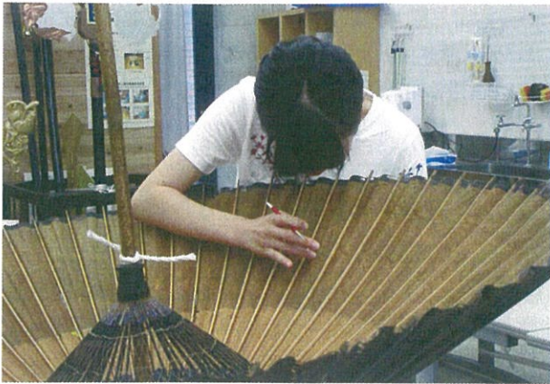
コーナー展「民俗資料の保存修復」