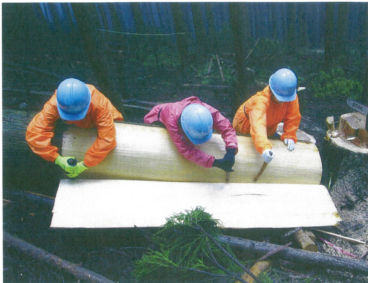
杉皮の採取 皮むき

木の輪郭に沿って規定の長さに切れ目を入れ、ヘラを差し込んで丁寧に皮を剥いていきます。夏の土用の間が適期です。昭和 30 年代には、吉野地域一帯で杉皮屋根の民家をみることができました。