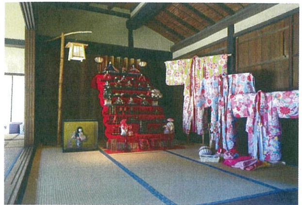
古民家でひなまつり

展示。期間中は、かまどのぬくもりを感じながら部屋に上がってのんびりと早春のひとときを過ごしていただいたり、また、かわいい着物を羽織っておひな様の前で記念写真撮影などを楽しむことができるコーナーも。