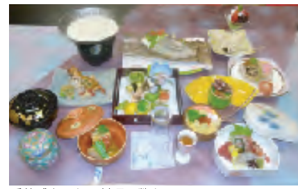
季節感あふれる料理の数々

地元の食材をはじめ、吟味した四季折々の旬の食材を生かした一品一品を、こだわりの器にしつらえています。目でも舌でも楽しめる会席を純和風のお部屋で存分にお楽しみください。