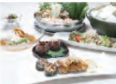
奈良でしか味わえない地産の味をどうぞ

当ホテルでは、地産地消にこだわり、大和肉鶏や大和野菜・吉野くずアザート・茶粥・黒米カレーなどを提供しています。大和肉鶏は、桜井市のフード三愛の新鮮な鶏を使用。また黒米カレーは、県農林部マーケティング課とタイアップして作りました。ぜひ、この機会にお召し上がりください。