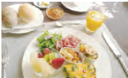
おでかけの朝に野菜たっぷりプレート

地元野菜をふんだんに使った健康でおいしい朝食をご提供しています。旅に出るとどうしても野菜が不足しがちになりますが、ボリュームたっぷり、身体にやさしい朝食で、お客様の旅を応援します。