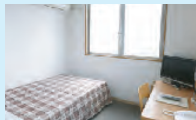
ゆっくりくつろげる客室

2008年に新装オープンした新築4年のキレイなお部屋です。お客様に気持ちよくお過ごしいただける空間づくりを心掛けております。全室インターネットも無料常時接続しておりますので、観光にもビジネスにも便利です。