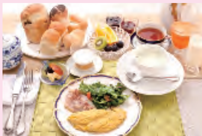
爽やかな朝に沢尻な朝食を

潤 hotobilのお食事は、和食・洋食にこだわらず、季節に合わせてお召し上がりいただきたい、そんなお食事をご用意したいと思っています。朝食も、焼きたてのパンやスープ、フレッシュジュースなど身体が喜ぶメニューをご提供しています。