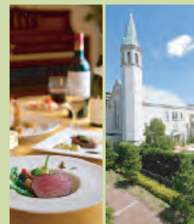
「リトルアン」のフレンチ 教会が目印

朝食は、古代の「蘇」や「ヒシオ」をはじめ、「大和ナデシコ卵」の温泉卵や「ヤマトポーク」のウィンナー、柿の葉ごと召し上がる「柿の葉蒸し」など、奈良の特産をふんだんに使用。お客様に大変ご好評いただいております。レストラン「リトルアン」のフレンチランチ・ディナーもおすすすめです。