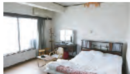
採光のよい広々としたシングルルーム

国宝である薬師寺や唐招提寺に近く、世界最古の木造建築物である法隆寺に歩いて行くことができ、観光に最適な立地です。駐車場も完備されているので、ビジネスにも便利です。