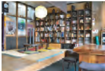
観光におすすめの本もいっぱい

世界各国から、また日本全国から来られるお客様に1泊2,500円というお手頃な料金で、ゆっくりゆったり奈良を観光していただいております。1階には奈良の本を集めた棚やカフェを併設。旅の計画や交流、情報交換にお役立てください。