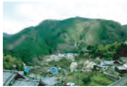
心癒されるのどかな風景が広がる

当民宿は、農業・林業を体験していただくことをコンセプトに運営しております。近年は海外のお客様にもご宿泊いただいております。お出しするお食事は、地場の食材や自家製米を使用した家庭料理で、安心・安全を吟味しております。