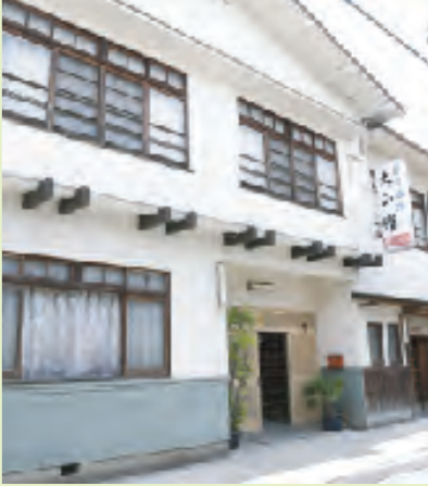
家庭的でホッと落ち着けるお宿

創業100年、「まごころ」をこめて、営業をおこなっております。吉野観光に便利な近鉄下市駅の近くにあり、おうちに帰ってきたような感覚で、ゆっくりお過ごしいただけます。