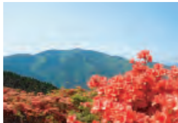
朱色に染まるツツジ園

葛城山の山頂からは360°Cのパノラマビュー、眼下には宝石をちりばめたような奈良と大阪の夜景が楽しめます。朝、小鳥のさえずりでの目覚めはすがすがしく最高です。魅力いっぱいのロッジで、ゆっくりお過ごしください。