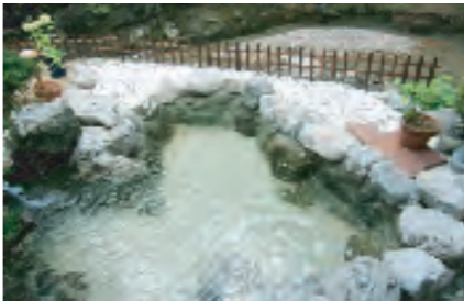
川べりの露天風呂

奈良・三重の県境、高見山のふもとに湧出する、専門家が『とんでもない』と表現した1万ppmを超える高濃度の温泉を施設に運んでの露天風呂が楽しんでいただけます。ぜひ心ゆくまでお過ごしください。