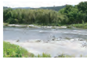
お宿裏にある浅瀬ではアウトドアも楽しめる

吉野山や飛鳥、大峯山系など近隣の観光地への訪問に大変便利です。また、リーズナブルな価格でお客様にご提供しています。心のもったサービスでお客様をおもてなしいたします。