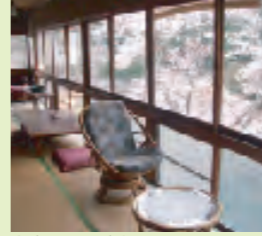
客室からは夜桜のライトアップも鑑賞できる

東吉野の中でも特に風光明媚な地「夢淵」は、古来より多くの歌が詠まれました。名前の由来は、神武天皇が東征のときに天神の夢の訓(おしえ)で「丹生(にう)川上の紺碧(こんぺき)の深い淵(ふち)に敵舎(いつべ)を沈めて、天神地祇(てんじんちぎ)を敬祭せよ」と云われ、それに従い大和平定を完遂、敵傍山の麓「榎原宮」で即位しました。そこで、大和平定を感謝し、誠を捧げてこの地名が生まれました。知る人ぞ知るパワースポットが、杉ヶ瀬の近くにあります。