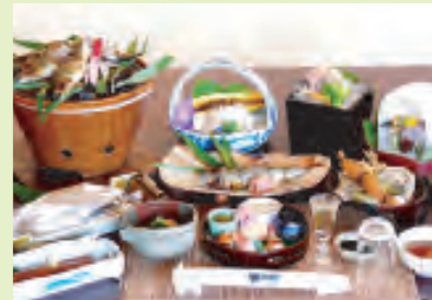
清流を眺めながら味わう鮎づくしの会席

四季折々の旬の食材を使った彩り鮮やかな会席料理がお召し上がりいただけます。鮎のフルコースは、5月26日(鮎解禁日)から9月中旬です。自然であたたかみのある本物の味をご堪能ください。