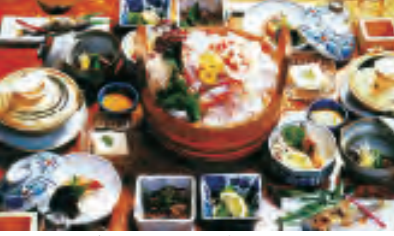
とれたて川魚をつかった会席

周辺の山川で育った旬の食材を伝統の味付けと自慢の腕で調理しています。春は山菜やいわな、夏はあゆ、秋は松茸、冬はポタン鍋...と、秘境の味を、ぜひお召し上がりください。庭園内では魚釣り体験や、幻想的なホテルの乱舞もお楽しみいただけます。