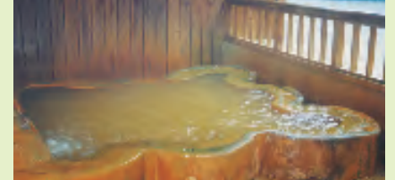
体も心も癒される炭酸泉の湯

神経痛などにも期待の高い全国でも珍しい炭酸泉の温泉です。総杉丸太作りの大浴場や巨大なケヤキで作った丸太風呂があり、自然の渓谷がパノラマのように一望できます。