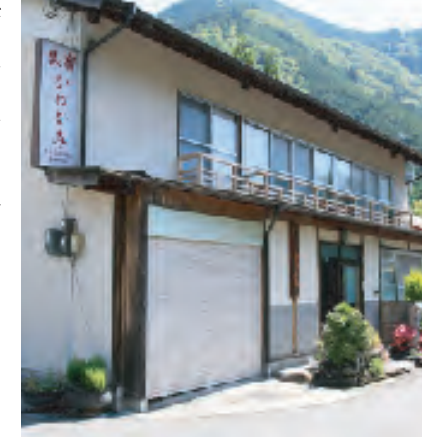
ほっこり心落ち着くお宿

見渡す限り山々が広がり、山の好きなお客様にはもってこいの場所です。車で約28分先に川やダムもあり、釣りもできます。ゆったり流れる時間の中で思う存分、アウトドアをお楽しみください。