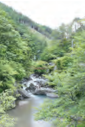
アウトドアを楽しみたい人にぴったり

外観 〒648-0307 吉野郡野迫川村北今西841 ☎0747-38-0157 【宿泊】料金(お一人様) ¥7,500~(税込)・1泊2食付