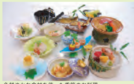
色鮮やかな食材を使った季節のお料理

当館の総料理長は、美食家で有名な北大路魯山人が創設した高級料亭『美食倶楽部』の神戸で総料理長を務めた経歴の持ち主です。ゆったりと贅を尽くした料亭の味をご堪能いただけます。