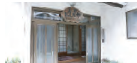
やすらぎに満ちた館内入口

ビジネスやご旅行、長期滞在も可能な家庭的なお宿です。民宿ならではの親しみやすい雰囲気でもてなします。