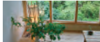
ほっこり落ち着く館内

天川村の大自然を眺望 〒638-0301 吉野郡天川村川合267 ☎0747-63-0018 【宿泊】料金(お一人様・税込) 3名様以上1室利用: ¥9,000 2名様1室利用: ¥9,500 1泊2食付・共同バストイレ http://misenkan.com/