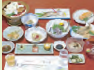
一品一品こだわりのある旬の会席

当館のお料理は、十津川村産の天然食材にこだわっています。夏は鮎、冬は選り抜きの地元産猪を使ったポタン鍋が自慢です。川のせせらぎに癒され、大自然に包まれながら、自然の恵みをご堪能ください。眼下に広がる「二津野の湖の色は深く碧く心落ち着く不思議色」。詩情漂う湖畔の宿で心の贅沢をご満喫ください。