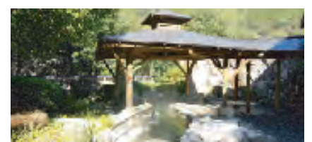
施設内に併設されている温泉「きんりの湯」

吉野ではトップの合宿集客施設です。天然芝のグラウンドに自然いっぱいの環境、天然温泉など設備が充実。格安プランや成人向けプランもあり、人数や目的に応じてご利用いただけます。