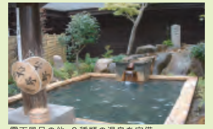
露天風呂の他、9種類の温泉を完備

源泉かけ流しの温泉は豊富な湯量と高温で9種類の湯舟に入っております。肌にやさしく保湿成分は基準の2倍もあり、美肌効果のあるほんまもの温泉です。