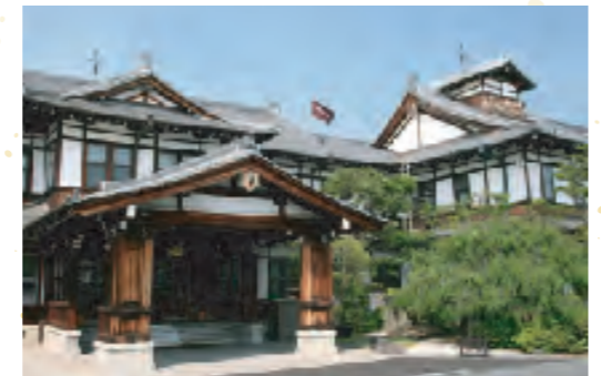
クラシックな輝きを放つ外観

エドワード8世、高浜虚子、ヘレンケラーなど、世界中から数々の賓客をおもてなししてきました。館内には、上村松園、堂本印象、富田溪仙などの絵画を飾っておりますので、いつでもご鑑賞いただけます。ロビーにはアインシュタイン博士が宿泊した際に弾いたピアノが残されています。クラシックな華やぎのある空間で、至福のひとつときをお過ごしください。