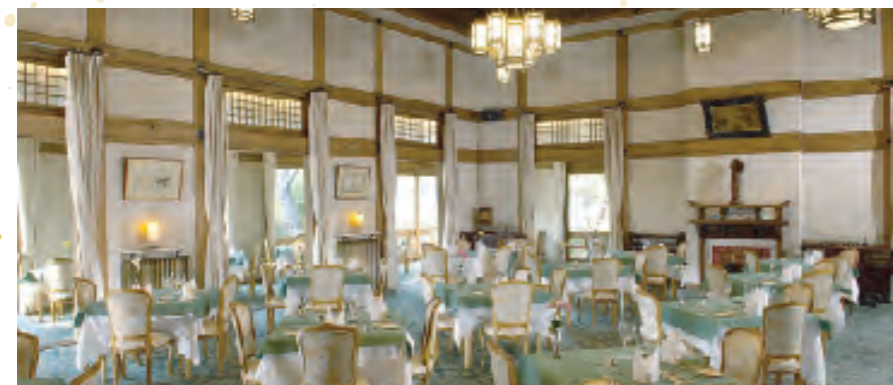
2011年10月にはメインダイニングルーム「三笠」が奈良県から「眺望のいいレストラン」に認定された

明治42年、「関西の迎賓館」として奈良公園の高台に創業。東京駅・日本銀行本店を設計した辰野金吾氏が設計し、鹿鳴館の約2倍の総工費をかけて建設されました。ロビー桜の間にはゆらぎのあるガラスが古き良き時代の面影を残し、明治・大正にタイムスリップしたような空間がひろがっています。