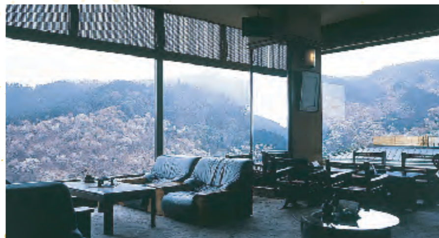
四季によって表情を変えてゆく吉野山