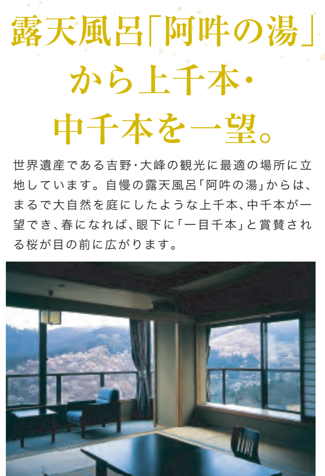
客室からも吉野山を一望