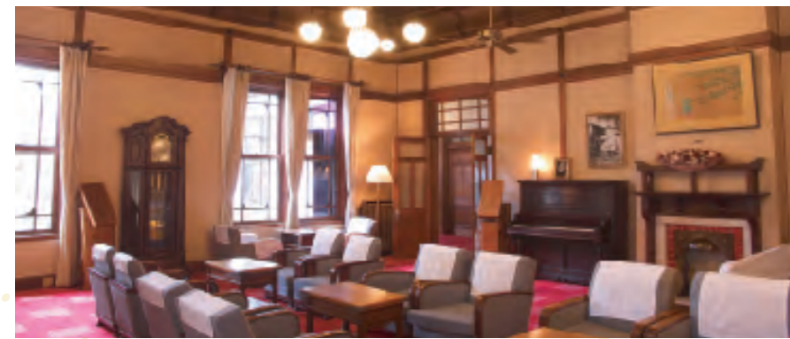
歴史を物語る調度品の数々