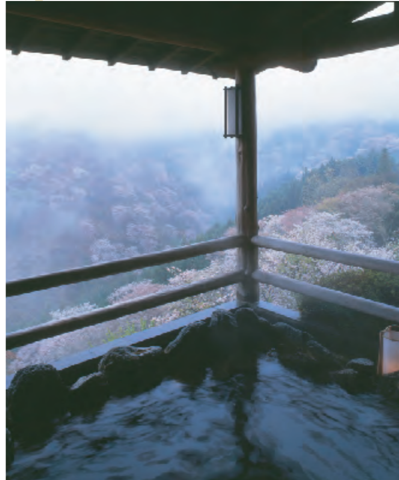
世界遺産を目前に入る露天風呂は、開放感たっぷり

中千本に位置し、ロビー客室、露天風呂から四季を通して絶景・吉野山を楽しめるお宿です。客室は、きめ細やかで美しい吉野の木材を使用。お料理は、吉野葛を四季の素材とあわせた会席膳が味わえます。冬季限定で自家製味噌を使った阿吽鍋など鍋メニューも豊富にご用意。本場スリランカのアーユルヴェーダも行っていきます(要予約)。