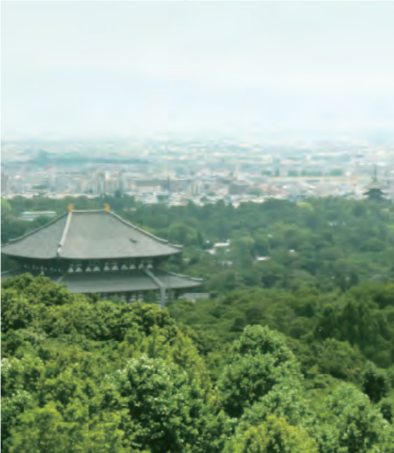
世界遺産の数々を一度に眺望

世界遺産の大仏殿・五重塔を眼下に、古都の佇まいに歴史が見える奈良市内の眺望処です。早朝の景色に昼間の眺め、すばらしい古都の夜景が楽しめます。春には敷地内や周囲が桜の名所でもあり、花見時は圧巻です。夏は緑に被われ、秋は美しい紅葉、冬には物静かな眺めと、古都の四季の美しさをお楽しみいただけます。夏のプールもおすすです。