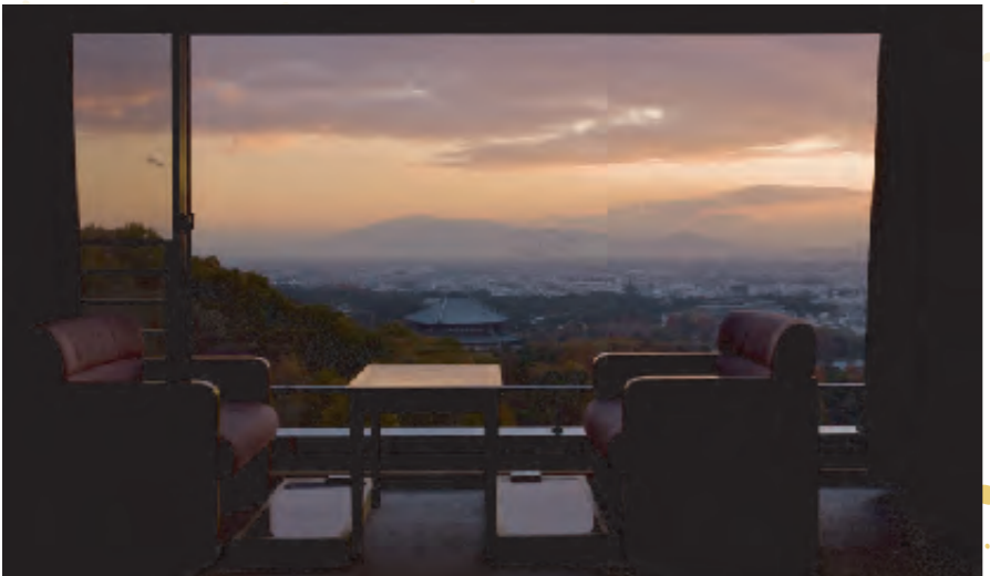
夕焼けの奈良市内を一望できる客室