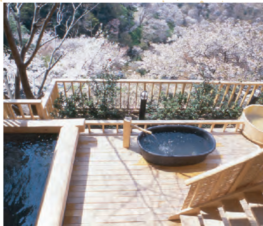
景観を楽しめる様々な露天風呂