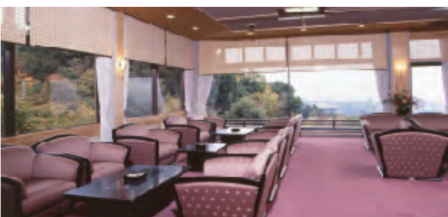
ゆったりくつろげるロビー