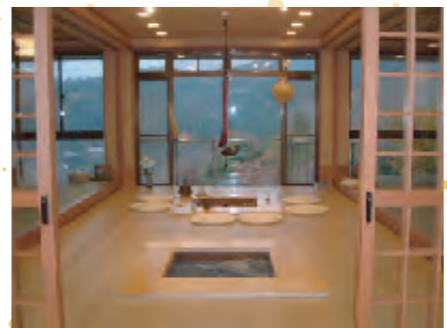
フロント「いろいろの間」