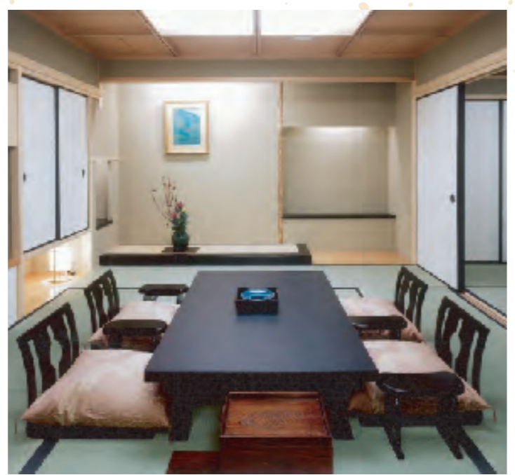
和式の客室は、ご家族のご旅行にぴったり