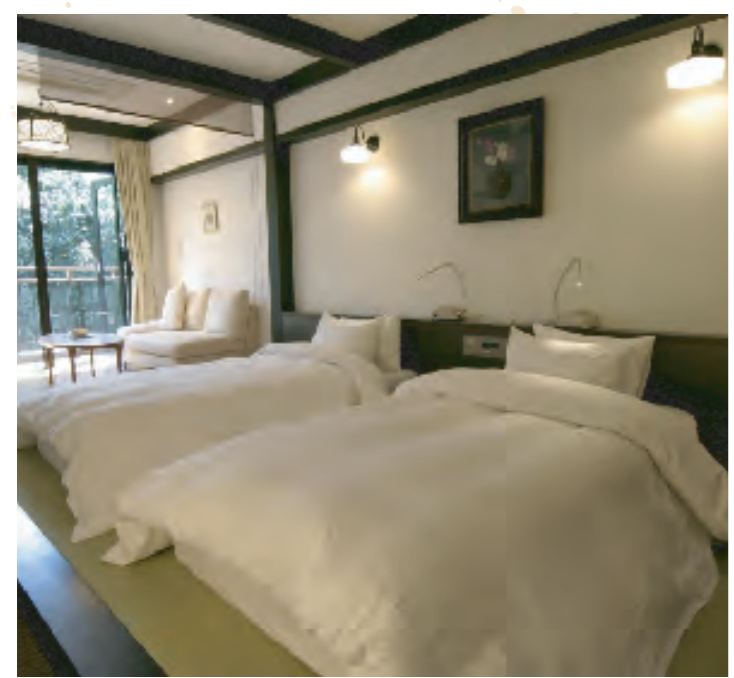
ビジネスにもおすすめの洋式の客室

近鉄奈良駅から徒歩約2分。奈良公園の玄関口に位置し、奈良の観光にはぴったりのお宿です。お料理は、奈良の食材を取り入れた季節の会席。開放感のある庭園露天風呂も好評です。高齢者に優しい宿としてシルバースターやフロント・客室係が日本の宿おもてなし検定を取得するなど、細部まで充実のサービスでお客様をお迎えます。