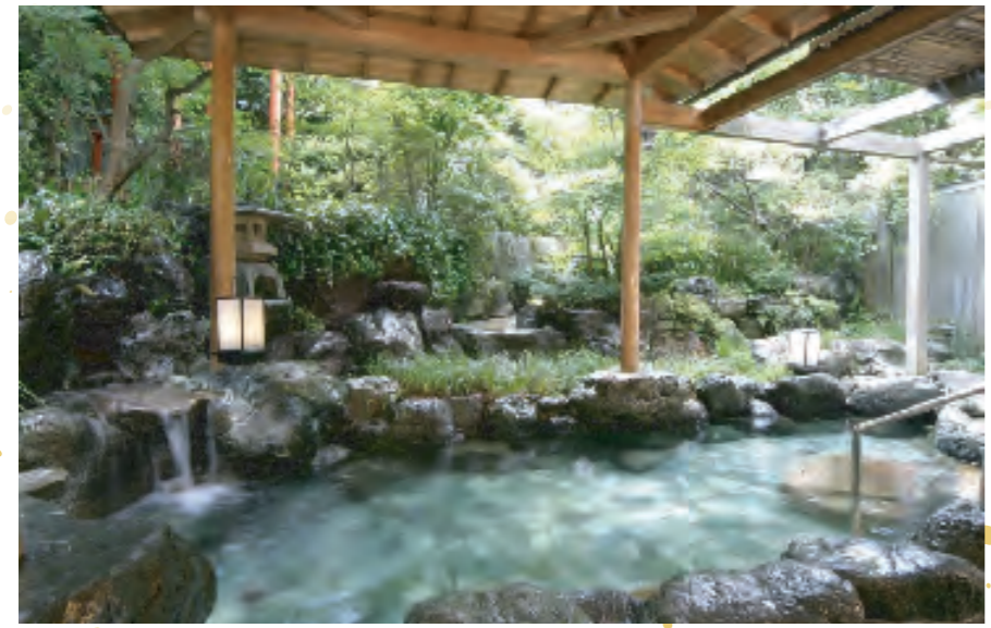
旅の疲れを癒す庭園露天風呂

奈良らしい正倉院校倉造りを模した外観、様々なタイプの客室、情緒あふれる庭園露天風呂が当館の自慢です。興福寺に隣接し、静かな時間をお過ごしいただけます。毎夕18時には「ゴーン」と鐘が響き渡り、風情もひとしおです。