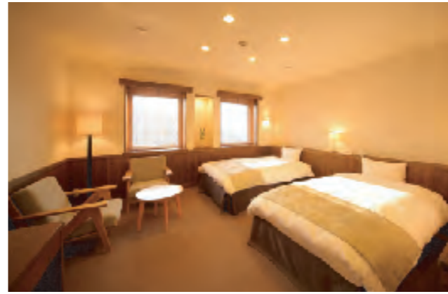
ワンランク上のご滞在を体験いただけるスーペリアルーム