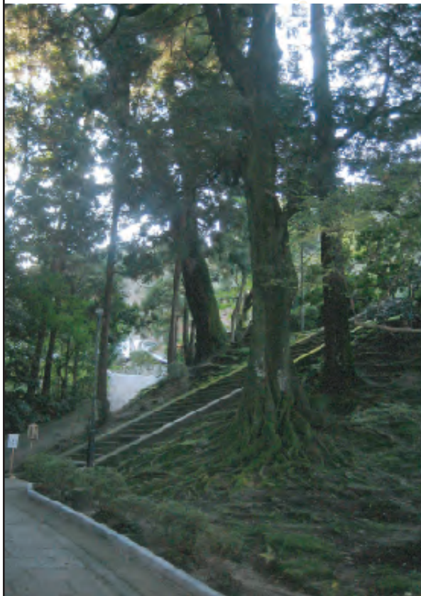
自然が生い茂る参道は散策に最適

あふれる緑の中に佇む国宝・本堂と重文・三重塔、光輝く黄金殿と白金殿。ご家族連れから小グループまで人数に合わせて和室が選ばいただけます。豊かな自然を愛でながらの散策や、ヘルシーで美容にいい薔薇をふんだんに使用した会席、そして薬師湯殿で薬草風呂に浸かり、心と身体がほっとするひとときを過ごせます。