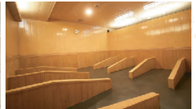
人気の岩盤浴もぜひ!(別途料金要)