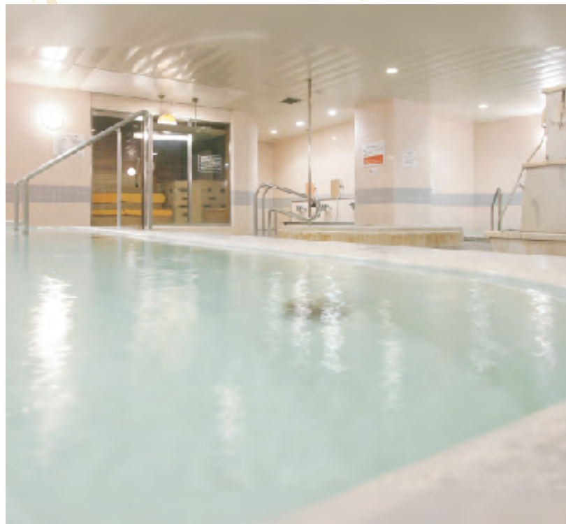
旅の疲れを癒す天然温泉「天平の湯」&サウナバス(ご宿泊者は無料)

広い館内、終日無料の駐車場を完備とご家族連れにぴったりのホテル。車を置いて、平城宮跡、古墳群、佐紀路へと、歩いて奈良を楽しむための拠点に最適です。天然温泉「天平の湯」やサウナバス、岩盤浴などリラクゼーションルームが充実。疲労やストレスを緩和しながら、ゆったりとした時間が過ごせます。