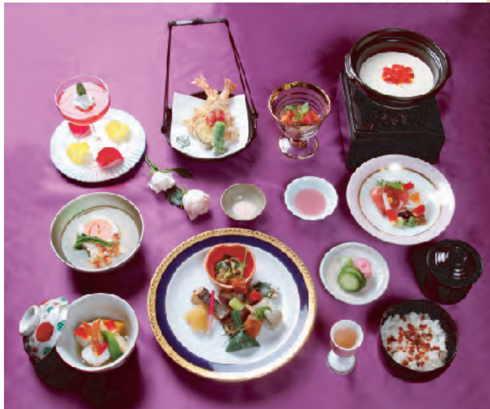
目にも鮮やかな「花会席ばら夢想」