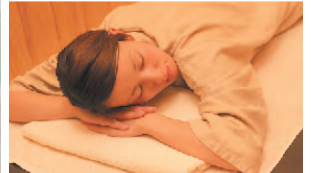
リラクゼーションでゆったり(別途料金要)