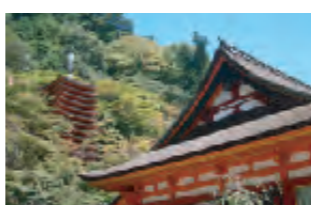
向かいにある談山神社