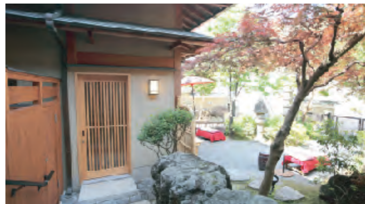
雅な日本庭園のある玄関口