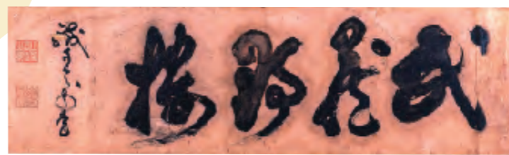
山岡鉄舟直筆の横軸

江戸時代から続く当館は、山岡鉄舟や谷崎潤一郎といった文化人や作家にも常宿としてご利用いただいていたました。ロビーには、山岡鉄舟直筆の横軸「武蔵野楼」が掲げられています。谷崎潤一郎の小説「吉野葛」にも主人公が泊まった宿として「むさし野」が登場しています。