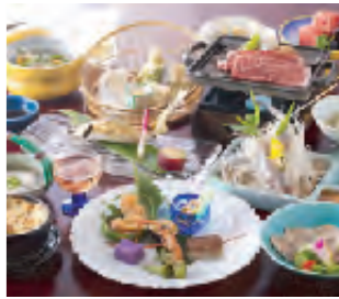
山の幸、地元の食材をふんだんに取り入れた会席