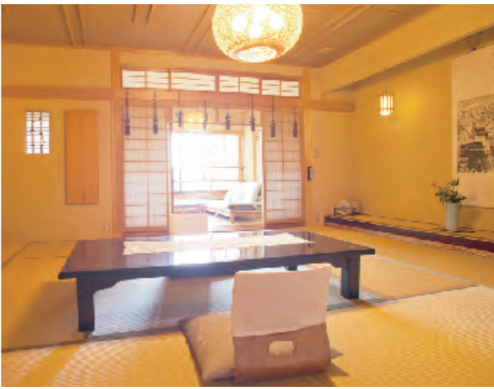
吉野杉、檜の吉野造りの客室

吉野山で最も古い伝統と由緒を誇り、古くは頼山陽、本居宣長など多くの文人墨客にこよなく親しまれてきたお宿です。東郷平八郎、高橋是清、伊藤博文なども宿泊し、今日も自筆が残されています。