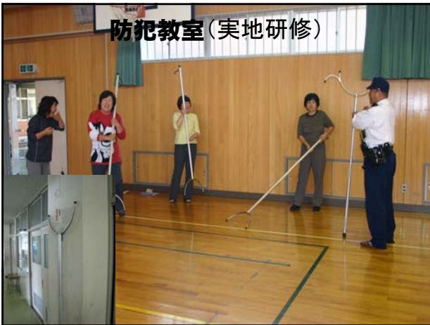
防犯教室(実地研修)