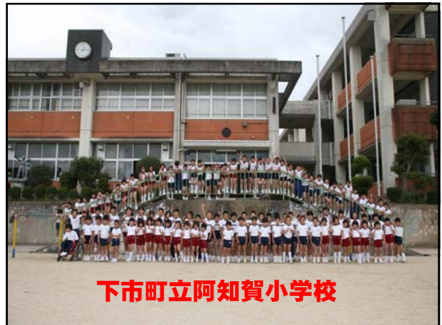
下市町立阿知賀小学校