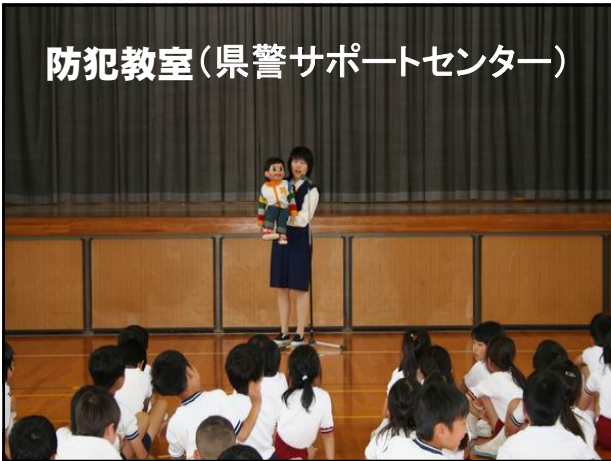
防犯教室(県警サポートセンター)