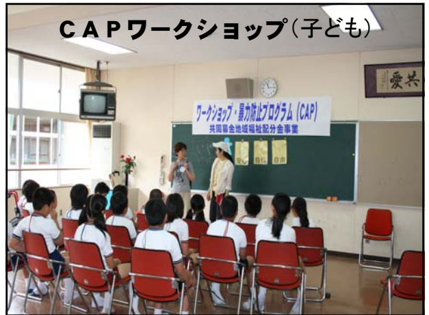
CAPワークショップ(子ども)