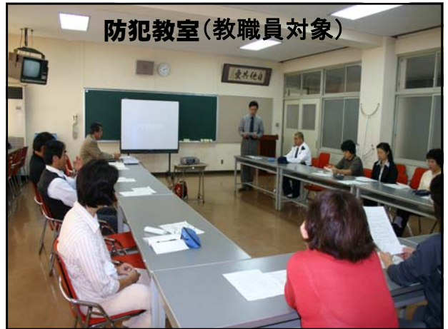
防犯教室(教職員対象)