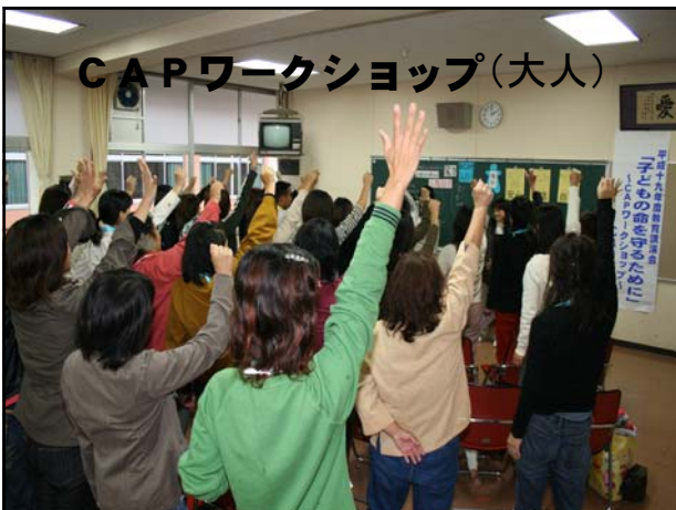
CAPワークショップ(大人)