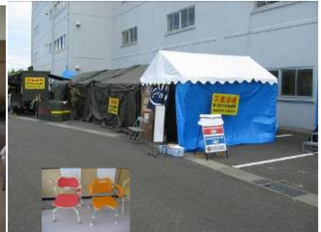
自衛隊の入浴支援、 介護用のいすも必要