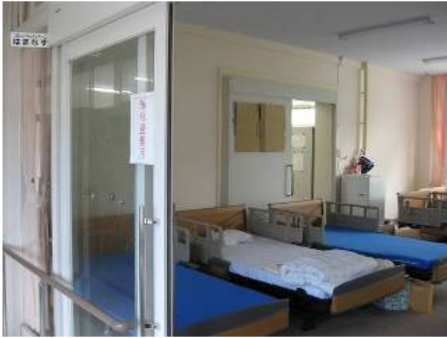
柏崎小学校のコミュニティ ルーム、音楽室