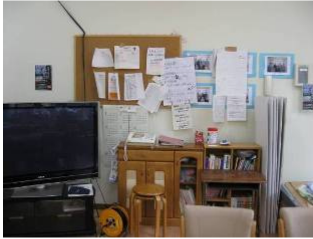
電話・掲示板・テレビ