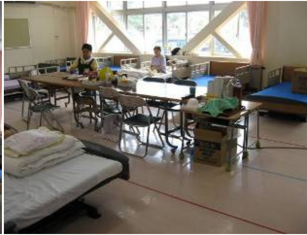
本格的な福祉避難所は 今回初めて設置