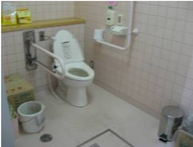
トイレは洋式で車いす対応 ポータブルトイレも使用