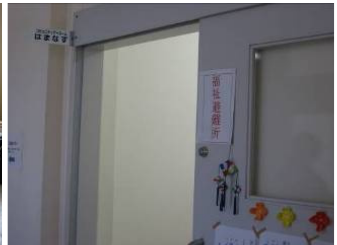
中央部分に支援者