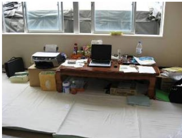
コーディネーターの部屋