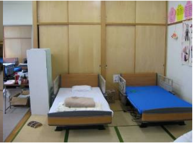
簡易ベッドを設置