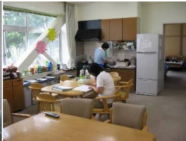
スタッフの執務室