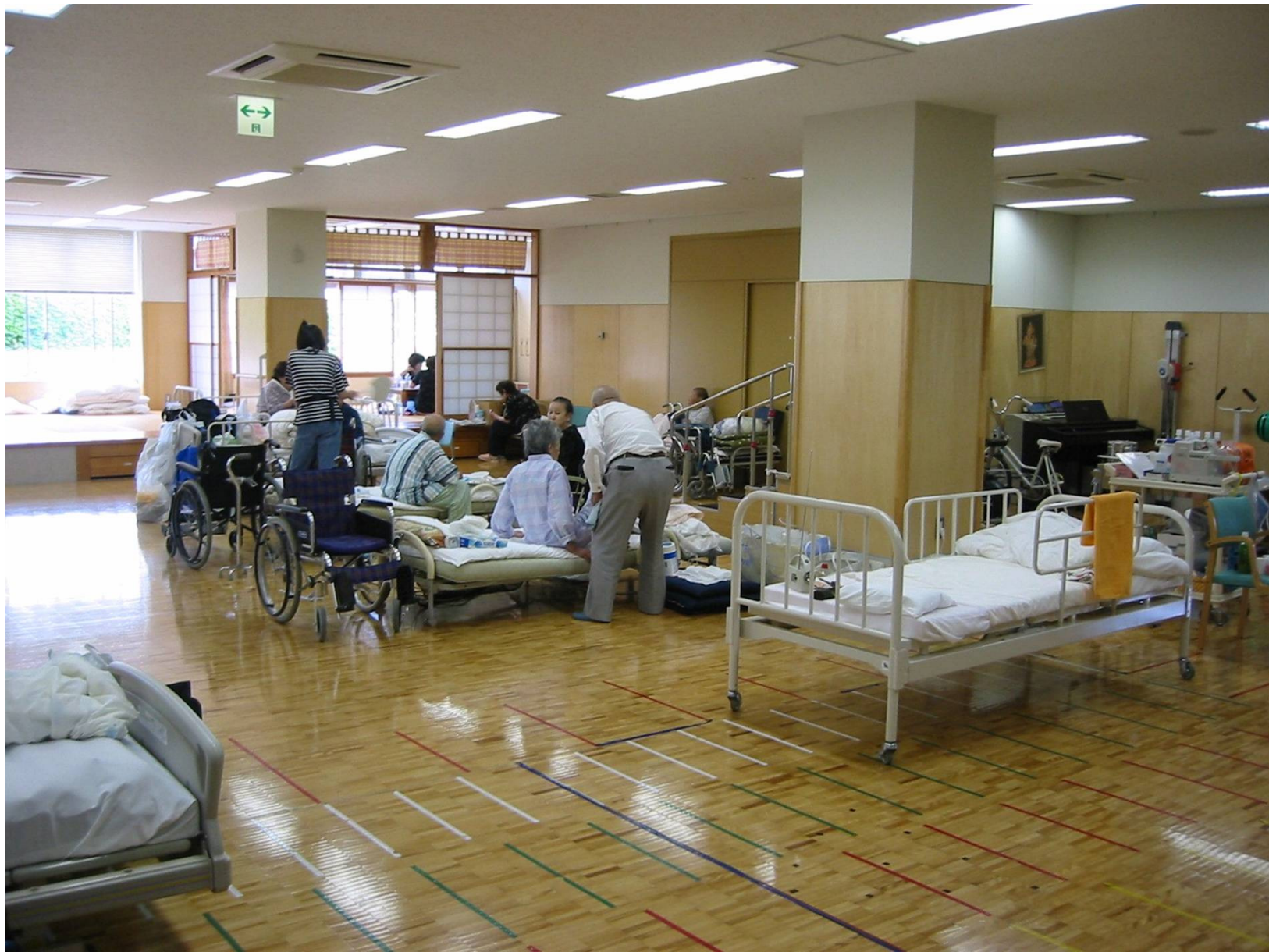
福祉避難所：元気館障害者デイサービスセンター