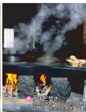
● かまど 焚き 休館日を除く毎日午前中1軒工・目・祝日は旧岩本家