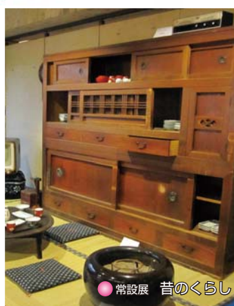
● 常設展 昔のくらし