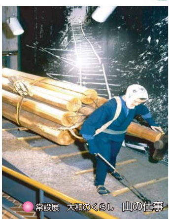
● 常設展 大和のくらし 山の仕事

奈良県立民俗博物館 〒639-1058 大和郡山市矢田町545番地 〈電話〉0743-53-3171 〈FAX〉0743-53-3173 〈URL〉 http://www.pref.nara.jp/1508.htm