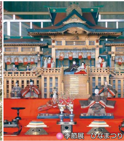
● 季節展 ひなまつり