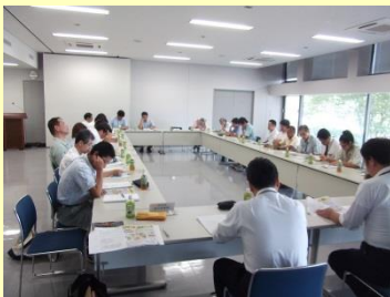
実行委員会の様子

○活動体制の整備 生産者や自治会で構成する実行委員会を構成し、地元住民などと協働して話し合える場を作っています。