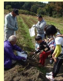
耕作放棄地を再生して芋掘り畑に