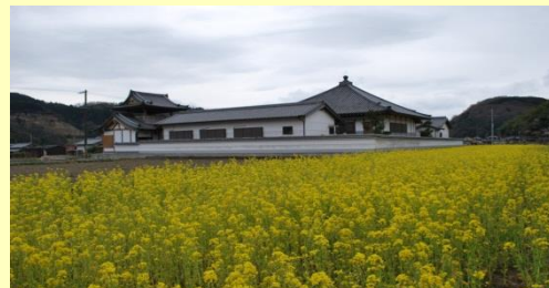
地域で植えられている菜の花畑

○活動体制の整備 生産者や自治会で構成する実行委員会を構成し、地元住民などと協働して話し合える場を作っています。