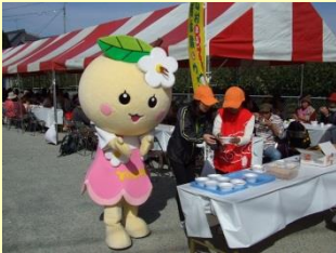
お茶・豚汁ふるまい